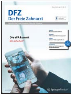
» Der Freie Zahnarzt – das Organ des FVDZ.