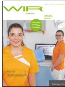
» WIR IN DER PRAXIS – das Magazin für das zahnmedizinische Fachpersonal.