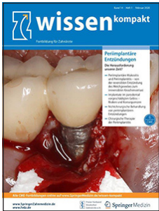
» wissen kompakt – die CME-Fortbildungszeitschrift zu Der Freie Zahnarzt.