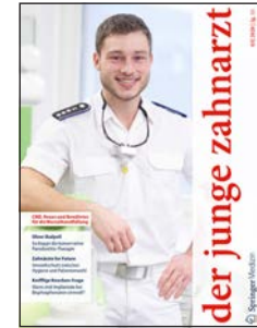
» der junge zahnarzt – der Titel für alle Berufseinsteiger.