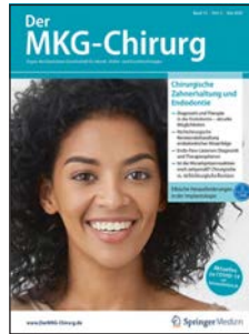
» Der MKG-Chirurg – der Titel für alle MKG-Chirurgen in Deutschland, Österreich und der Schweiz.